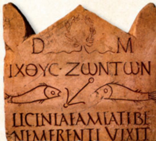
Stèle chrétienne des premiers siècles

Le lien qui unit les baptisés dépasse les barrières ethniques et sociologiques. Nous lisons dans l'Epître aux Galates : « Vous avez revêtu le Christ. Il n'y a plus ni juif ni grec, ni esclave, ni homme libre ; il n'y a plus l'homme et la femme ; car vous n'êtes qu'un dans le Christ Jésus. » (Gal 3-28). Les premières Eglises sont donc ouvertes.