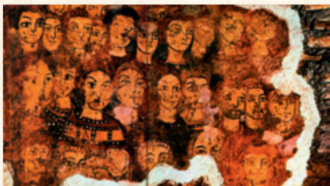
Les premiers Chrétiens, fresque de St Clément à Rome

circstances, demande à être recadré. Selon le dictionnaire LE ROBERT « la solidarité est une relation l'obligation morale de ne pas desservir les autres membres et de leur porter assistance. Cette assistance de la charité qui s'exerce du donateur vers le bénéficiaire sans idée de retour. Le don charitable peut-être autre nature. Elle peut s'exercer au sein d'un groupe qui dépend des intérêts financiers communs, ou religion se sontentraîdés. Le danger est que cette solidarité aboutisse à une forme de communautarisme et l'ouverture bienveillante sur l'extérieur. Non seulement les baptisés des premières églises se portaient social environnant. Les écrits chrétiens du siècle qui a suivi la mort de Jésus nous éclairent abondamment