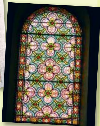
Reproduction d'un vitrail de N o Dame du Val d'Amour