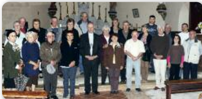
1 EHPAD Bellevue Au quartier Alzheimer