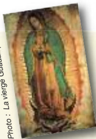
Photo : La vierge Guadalupe

1921 à Mexico, un homme entre dans la cathédrale et dépose un magnifique bouquet de fleurs aux pieds de l'image de la Vierge de Guadalupe. Quelques instants plus tard, c'est le chaos. L'explosion a tout détruit, mais l'image de la Vierge est intacte ! Parler de la Vierge de Guadalupe, c'est parler de foi, de passion religieuse, de vénération. Pour des millions de catholiques, c'est la matérialisation d'un miracle. Chaque 12 décembre, près de 15 millions de personnes font le pèlerinage jusqu'à la Basilique située sur le mont Tepeyac près de Mexico, et ce, depuis près de 500 ans. Cette image est considérée par l'Eglise catholique d'origine divine car c'est la Vierge elle-même qui a teint les fibres de la tilma (cape) de San Juan Diego comme preuve de son apparition.