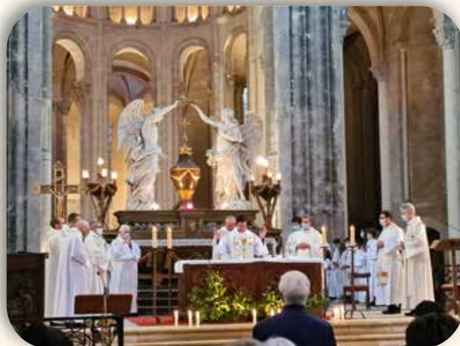
Père Pierre, 27 septembre à Gaillac

RAPPEL IMPORTANT : Le don au Denier de l'Eglise est indépendant de l'abonnement au Réveil Graulhétols