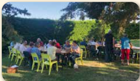
Repas du Mouvement Chrétien des Retraités, le 29 juin à En Galinier.