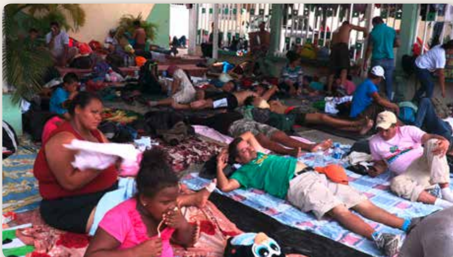
Fin octobre 2018 à Mapastepec, Chiapas : des membres de la caravane des migrants d'Amérique Centrale font une pause dans l'église de Mapastepec avant de reprendre leur route vers les États-Unis.

expériences et réfléchissaient à promouvoir des actions constructives de visions différentes des migrations.