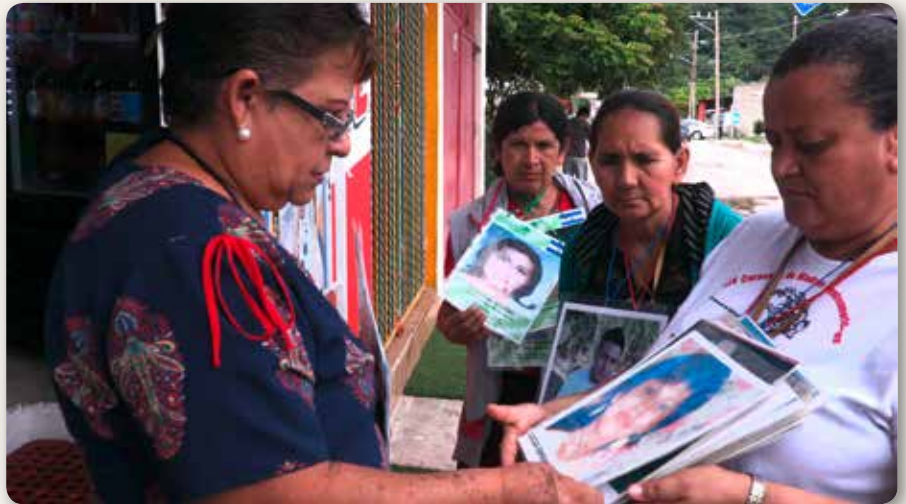
Fin octobre 2018 à Coatzacoalcos, Veracruz, Mexique : Des mères de migrants d'Amérique Centrale disparus sur la route des États-Unis montrent des photos à des riverains pour tenter de retrouver leur trace.

Ludovic Bonleux, vit depuis vingt ans au Mexique. A l'origine professeur d'histoire, il s'est peu à peu spécialisé dans le tournage de documentaires mettant en scène des « sans-voix » victimes de la violence endémique au Mexique. Son dernier long métrage a obtenu de nombreux prix dans son pays et même aux États Unis. Ce dernier, « Guerrero » sera sans doute projeté dans notre proche région au printemps. Dernièrement, il a accompagné la « caravane des mères de migrants disparus » de la