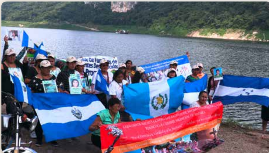
Fin octobre 2018 à la Angostura, Chiapas, Mexique : Les membres de la Caravane des Mères des migrants d'Amérique Centrale disparus posent devant le lac qu'elles doivent traverser pour se rendre à Tuxtla Gutierrez, Chiapas.

frontière du Guatemala jusqu'à Mexico. Il offre au Réveil quelques photos d'un groupe de migrants centraméricains en route vers les États Unis.