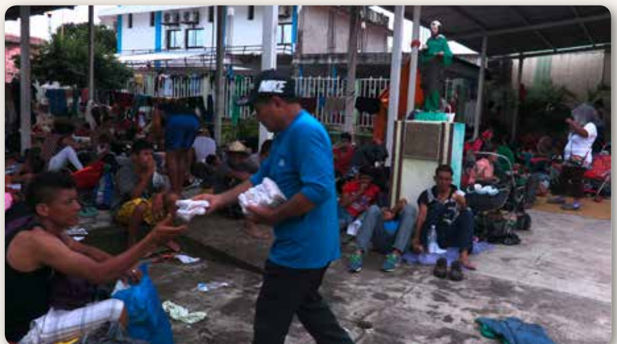
Fin octobre 2018 à Mapastepec, Chiapas : Un riverain offre de la nourriture aux membres de la caravane des migrants d'Amérique Centrale qui font une pause dans l'église de Mapastepec avant de reprendre leur route vers les États-Unis.

La huitième édition du Forum Social Mondial des Migrations se tenait cette année à Mexico, dans un pays traversé par des milliers de réfugiés d'Amérique Centrale. Sur le thème « Migrer, résister, construire et transformer », des représentants de nombreuses instances du monde entier y étudiaient, partageaient leurs