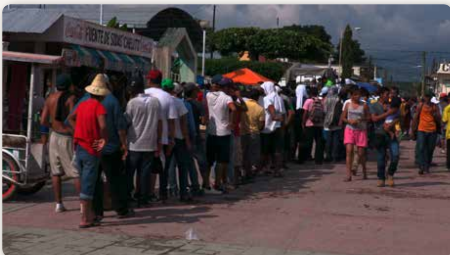
Fin octobre 2018 à Mapastepec, Chiapas : Des membres de la caravane des migrants d'Amérique Centrale font la queue pour recevoir de la nourriture lors d'une pause dans la ville de Mapastepec avant de reprendre leur route vers les États-Unis.