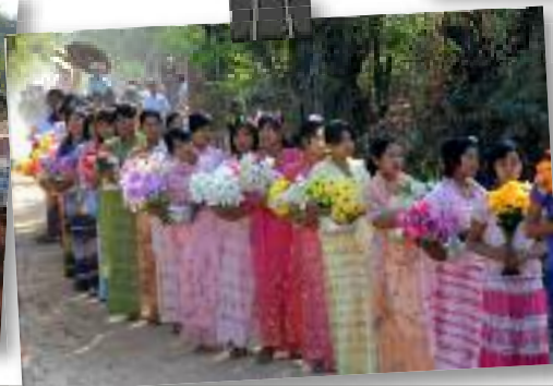
Procession dans le village de Poisso