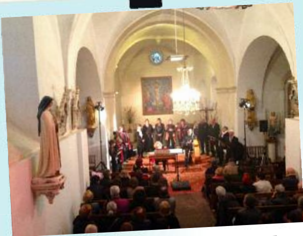
Concert vocal CLIZIA DIMANCHE, 18 OCTOBRE à St Mémy