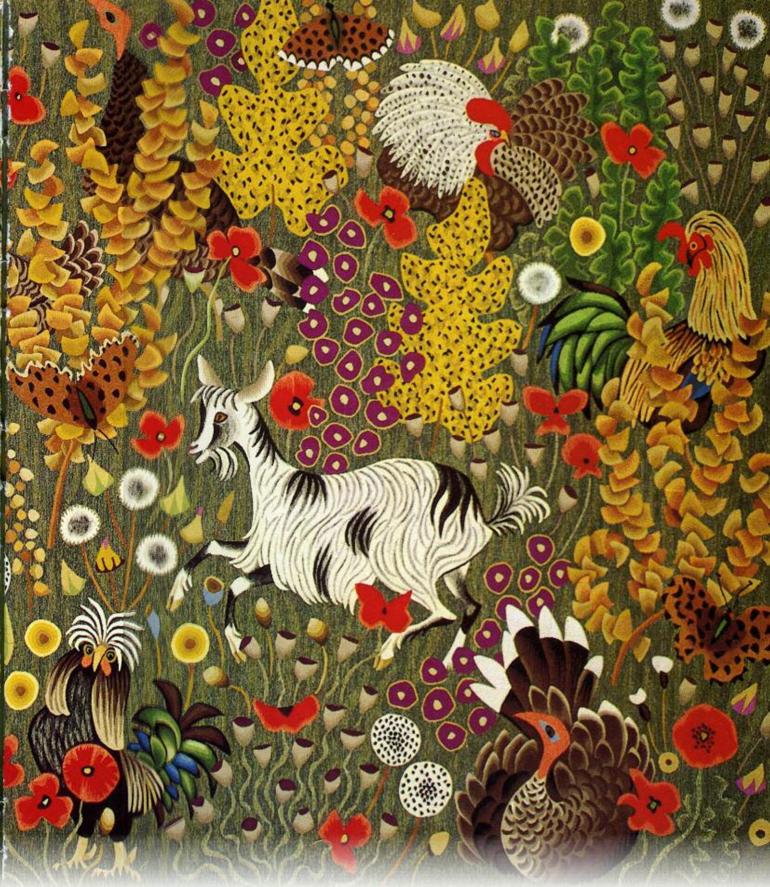
Plein champ/ tapisserie de Dom Robert/ Musée de Sorèze