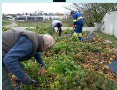
Graulhet, végétal antipollution