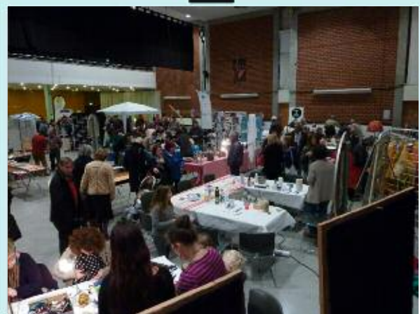
Salon de la Récup, dimanche 29 novembre au forum