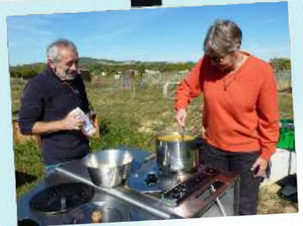
Graulhet, les jardins partagés