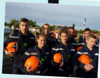
Les JSP de Graulhet