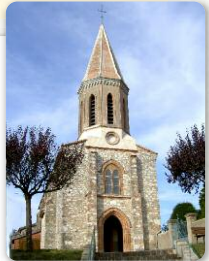
Eglise de St Martin de Casselvi

Prions aussi pour celles et ceux qui, aujourd'hui, dans de nombreux pays, sont victimes d'idéologies religieuses ou politiques intolérantes et violentes. Pour les chrétiens d'Orient persécutés.... »