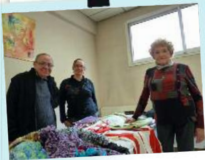
Joyeux Pinsons, Graulhet, 29 nov 2015