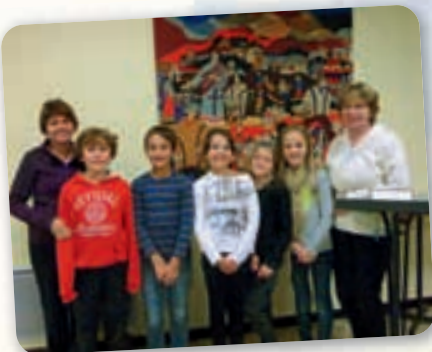
Briatexte, les C.M2 du lundi