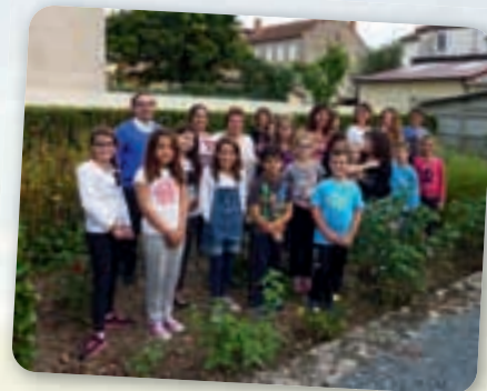
Graulhet, le groupe du jeudi