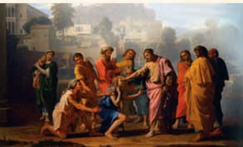
La guérison de deux aveugles