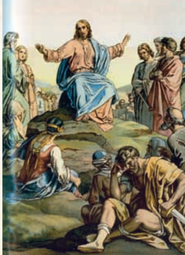
Le sermon sur la montagne

Le terme Seigneur (Kyrios en grec) est provocateur car cette appellation est réservée à Dieu lui-même dans l'Ancien Testament.