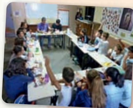
Les collegiens partagent le repas