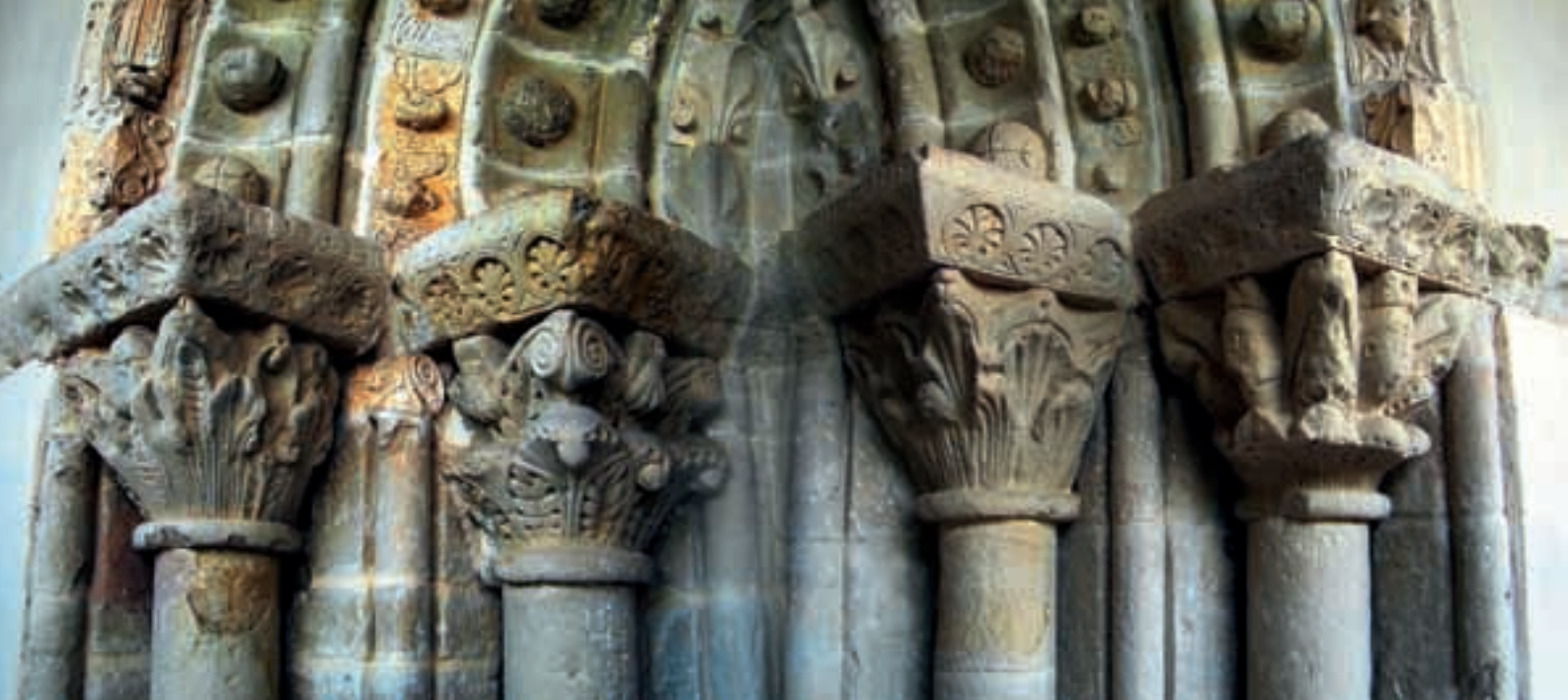
Portail église St Pierre de Monestier, à St Gauzens