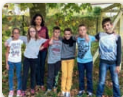
Briatexte, les C.M1 du mardi