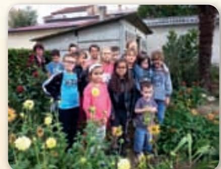
Graulhet, le groupe du lundi