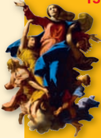
Illustration : assumption (histoire visuelle de la Bible - National Geographic).